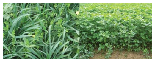
Avoine (à gauche) et moutarde (à droite) des engrais verts semés à la fin du mois d'août